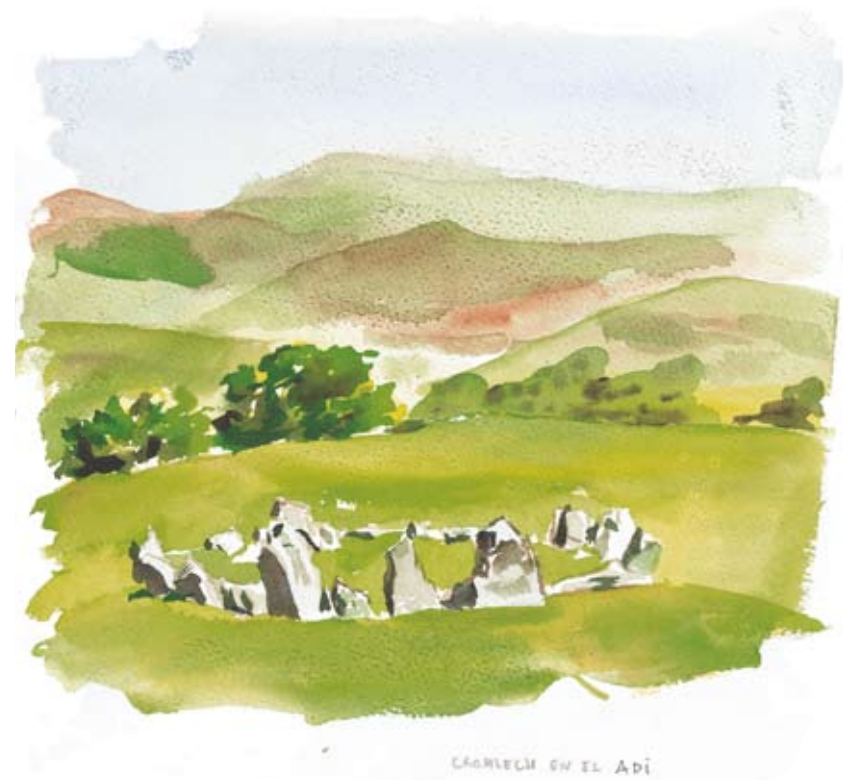
Crómlech en el Adi.

Ondoren, Oteizak arte neolitikoaren azken fasean lekutzen du, aurreko guztiaren gainditzea, goreneko abstrakzio.