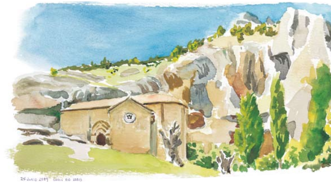
Ermita en el Cañón de Río lobos, Soria.

Zertxobait geroago, Eliza Katolikoan, gertaera guzti horien berri izan zutenean, tenpluak eraiki zituzten toki horietan bertan. Jainkotasun paganoak santu kristau bihurtu ziren. Vatikanoa bera sakratutzat emana dagoen toki baten gainean eraikia dago, harri bertikal batek nabarmendua.