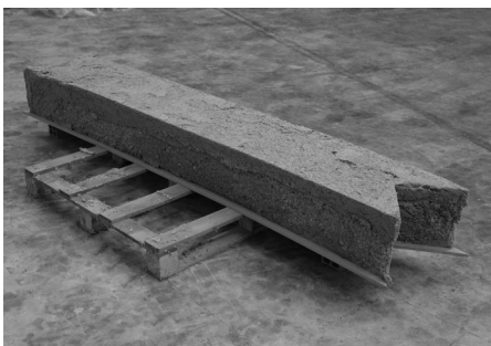
El vacío entre dos esculturas

Esta exposición forma parte del programa Hazitegia , desarrollado conjuntamente por la Fundación Museo Jorge Oteiza y el Centro de Arte Contemporáneo de Huarte, con el objetivo de generar nuevos escenarios de reflexión en torno a la obra de Jorge Oteiza desde la creación contemporánea y ha contado con la colaboración de Innova Cultural de Fundación Caja Navarra y Fundación la Caixa.