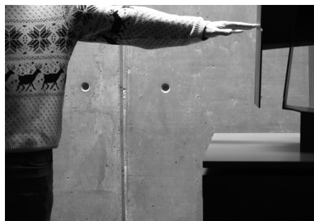
Midiendo el espacio entre las obras de Oteiza

© Jorge Oteiza © Pilar Oteiza, A+V Agencia de Creadores Visuales, 2021